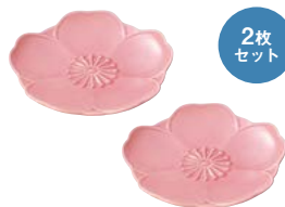
2枚 セット 咲楽 はな咲く小皿二枚組 30806-209 (000600)

ご提供価格 ¥398 税別 発送単位 12個 商品サイズ 120×300×300mm 個装形態 デザイン袋 材質 ポリエステル・PP 色 イエロー・グリーン・レッド 3色取混ぜ