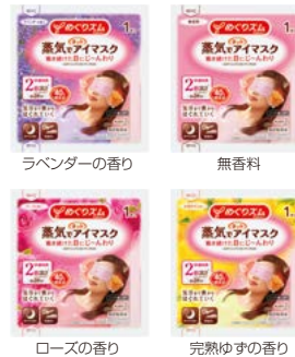
ラベンダーの香り

発送単位 24個(12入×2カートン) 商品サイズ 159×90×67mm 個装形態 無包装 備考 カートン割れ不可 ※2カートン結束での出荷となります。 ※カートン単位で取り混ぜできます。 ※受注日より4日以降の出荷となります。