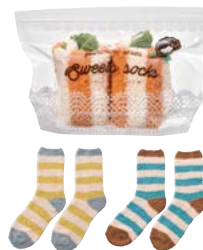
ふわもこスイーツソックス 31920-209 (000500)

ご提供価格 ¥328 税別 発送単位 60枚 商品サイズ 700×1000mm 個装形態 透明袋 材質 ポリエステル 色 イエロー・ブルー・レッド 3色取混ぜ 備考 並行輸入品