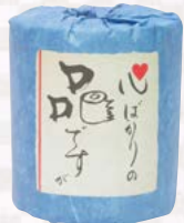
心ばかりの品ですが