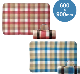
スタイルブロック バンド付ブランケット 31904-209 (000700)

ご提供価格 ¥218 税別 発送単位 96枚 商品サイズ ブランケット/600×900mm、 収納時/約φ90×240mm 個装形態 デザイン袋 材質 ポリエステル、 バンド/PP(不織布) 色 ブルー・レッド 2色取混ぜ