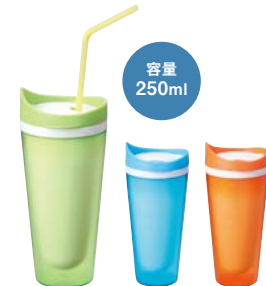
飲み口3WAY カラフルタンブラー 31518-209 (000600)

ご提供価格 ¥248 税別 発送単位 24個 商品サイズ 開き時/40×305×305mm、 畳み時/80×320×155mm 個装形態 透明袋 材質 ポリエステル・PE 色 ブルー・レッド 2色取混ぜ