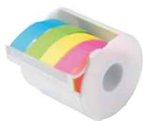
4色ふせんテープ 31526-209 (000300)

ご提供価格 ¥2,480 税別 発送単位 18個 商品サイズ 98×186×82mm 個装形態 化粧箱(105×194×90mm) 材質 ABS 備考 LED3灯式、手動充電式