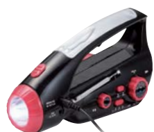
マルチ充電ライト&ラジオ (スマホ対応) 30210-209 (007500)

ご提供価格 ★¥148 税別 発送単位 96個 商品サイズ φ72×165mm 個装形態 透明ケース(165×72×72mm) 材質 AS・PP・PE 色 オレンジ・グリーン・ブルー 3色取混ぜ 備考 容量/250ml