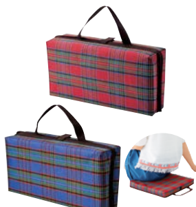
ポータブルジャークション 30185-209 (000800)

ご提供価格 ¥148 税別 発送単位 480個 商品サイズ 全長/119mm 個装形態 透明ケース(20×60×124mm) 材質 ABS・スチール