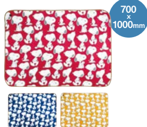
スヌーピー あったか3WAYブランケット 31898-209 (001100)

ご提供価格 ¥218 税別 発送単位 96枚 商品サイズ ブランケット/600×900mm、 収納時/約φ90×240mm 個装形態 デザイン袋 材質 ポリエステル、 バンド/PP(不織布) 色 ブルー・レッド 2色取混ぜ