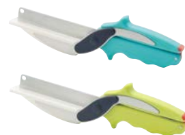
サクッとカンタン! ハサミ包丁 31322-209 (000900)

ご提供価格 ¥238 税別 発送単位 40個 商品サイズ 77×224×143mm 個装形態 化粧箱(80×225×145mm) 材質 PP・PS・ステンレス 色 ピンク・ブルー 2色取混ぜ 備考 容量/1450ml