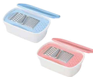
保存容器になる マルチおろし器 30872-209 (000600)

ご提供価格 ¥158 税別 発送単位 48枚 商品サイズ φ165×20mm 個装形態 化粧箱(25×166×168mm) 材質 陶器 種類 クマ・シロクマ・トリ・ネコ・ プタライオン 6種取混ぜ 備考 カートン割れ不可