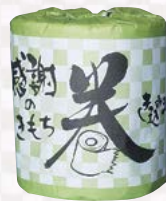
感謝のきもち 巻き込みました

ご提供価格 ¥65 税別 発送単位 100個 商品サイズ φ97×118mm 個装形態 紙巻 材質 再生紙 備考 カートン割れ不可