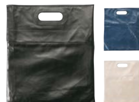
ラヴィネ クラッチ&トートバッグ 31341-209 (001000)

ご提供価格 ¥198 税別 発送単位 60個 商品サイズ 29×178×92mm 化粧箱(31×180×94mm) 個装形態 PVC・PS・紙