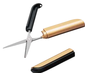
ザ・プレミアム スマートハサミ 31209-209 (000350)

ご提供価格 ¥190 税別 発送単位 36個 商品サイズ 本体/φ109×190mm 化粧箱(203×117×112mm) 個装形態 PP 材質 イエロー・グリーン・ピンク・ ブルー 4色取混ぜ 備考 容量/本体:830ml・ ディップケース:70ml