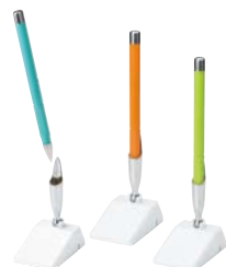
スタンディングボールペン 31731-209 (000250)

ご提供価格 ¥124 税別 発送単位 180個 商品サイズ 56×56×68mm 個装形態 化粧箱(58×70×58mm) 材質 PS・紙