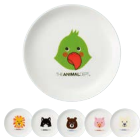
アニマルデブト プレート 31708-209 (000500)

ご提供価格 ¥268 税別 発送単位 48セット 商品サイズ φ118×21mm 個装形態 化粧箱(40×120×123mm) 材質 陶器 備考 カートン割れ不可