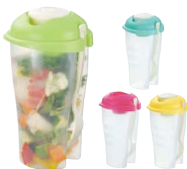
シェイクサラダポット 29291-209 (000600)

ご提供価格 ★¥248 税別 発送単位 60個 商品サイズ 244×70×27mm 個装形態 化粧箱(33×252×68mm) 材質 ステンレス・ABS・PP 色 グリーン・ブルー 2色取混ぜ