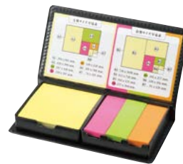
デスクトップふせんセット 29704-209 (000700)

ご提供価格 ¥88 税別 発送単位 360本 商品サイズ 168×40×63mm 化粧箱(154×54×32mm) 個装形態 ABS 材質 オレンジ・グリーン・ブルー 3色取混ぜ