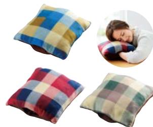
クルトチェック ハンドウォームクッション 31180-209 (001000)

ご提供価格 ¥148 税別 発送単位 108組 商品サイズ レディースフリーサイズ 個装形態 デザイン袋 材質 ポリエステル・ポリウレタン 色 イエロー・オレンジ・ブルー 3色取混ぜ